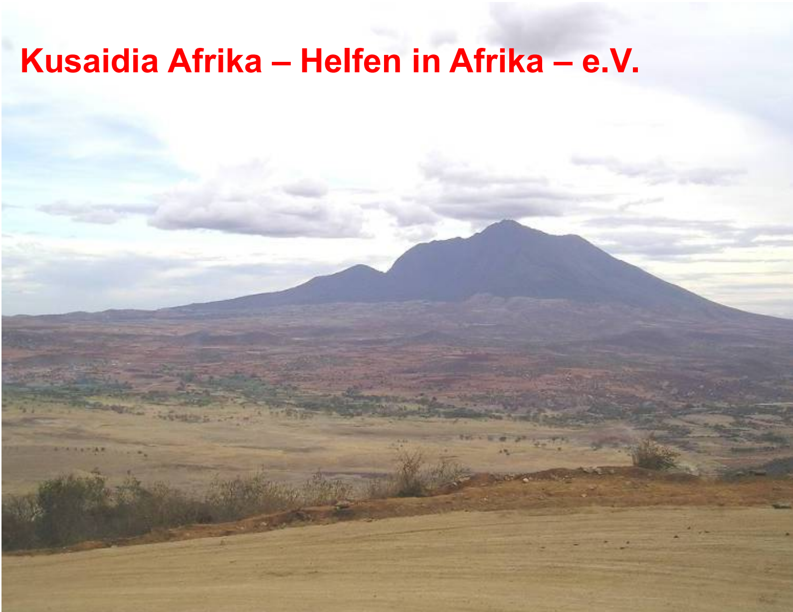
Mount Hanang, ein beeindruckender erloschener Vulkan am Rift Valley in der Nähe von Dareda und Bashanet.